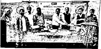
farmers in improved agricultural activities throughout the year, 12 people have been provided with integrated vegetable cultivation and 8 people with ginger cultivation in sacks, a total of 20 people have been provided with financial assistance of 5 thousand taka and 1 lakh taka. In order to involve the disabled in income-generating activities, 8 people have been provided with goat farming in lots, 1 person with swan farming and 1 person with ginger cultivation in sacks, a total of 10 people have been provided with financial assistance of 5 thousand taka and 50 thousand taka.